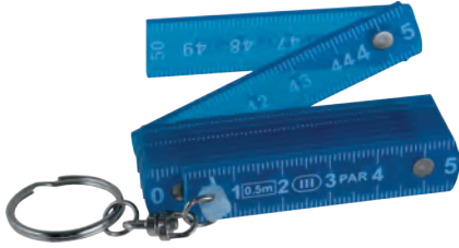
Miarka składana breloczek Folding rule keychain Mini Gliedermaßstab